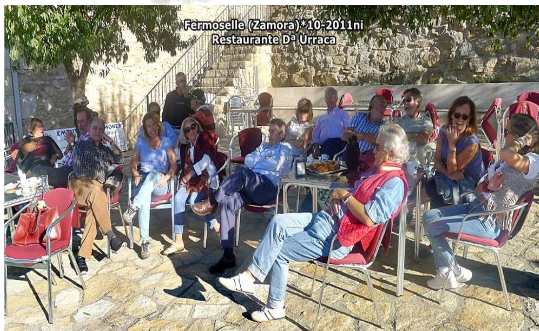
Fermoselle (Zamora) * 10-2011ni Restaurante D a Urraca