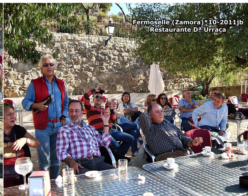
Fermoselle (Zamora) * 10-2011jb Restaurante D a Urraca